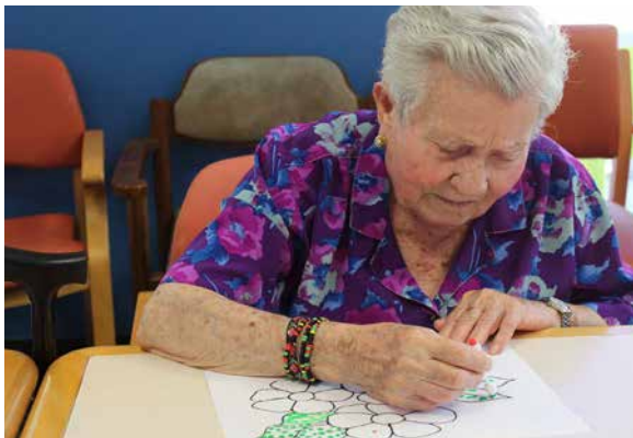
Taller de pintura.