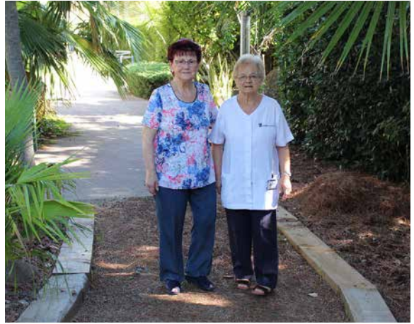
Pastoral de la Salud.