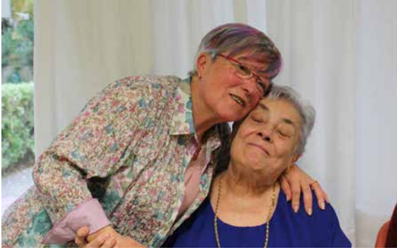
Voluntaria con una residente.