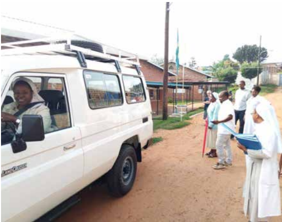
Nueva ambulancia para el Centro de Salud de Nyarusange (Ruanda).