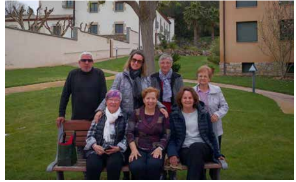
Equipo de Voluntariado de la Residencia.