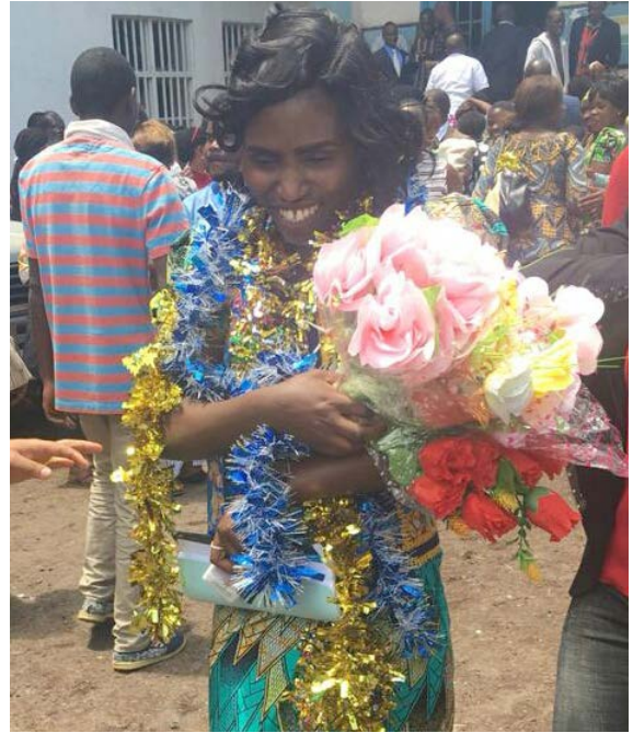
Graduación de una de las universitarias becadas.