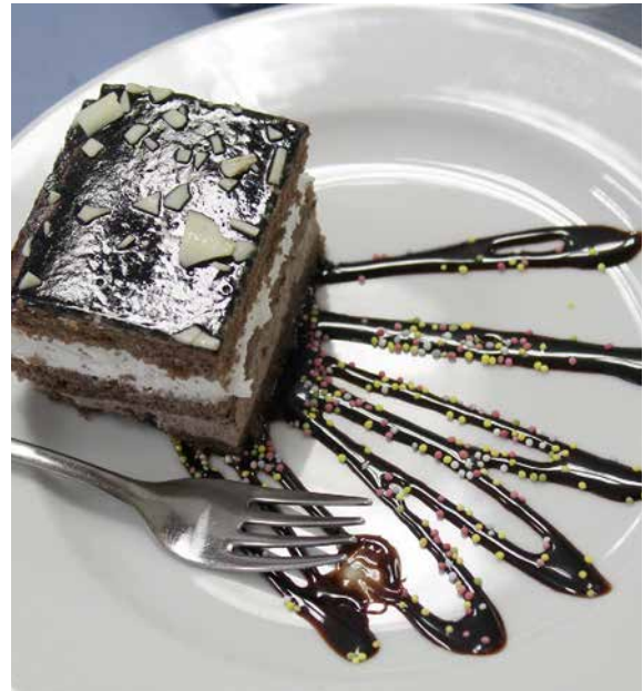
La Residencia dispone de un servicio de cocina propia que hace las delicias de los residentes.