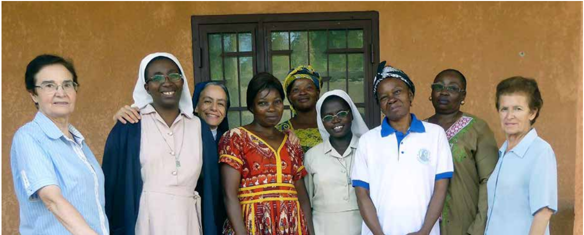
Simpatizantes del Carisma, en Nkolondom (Camerún).