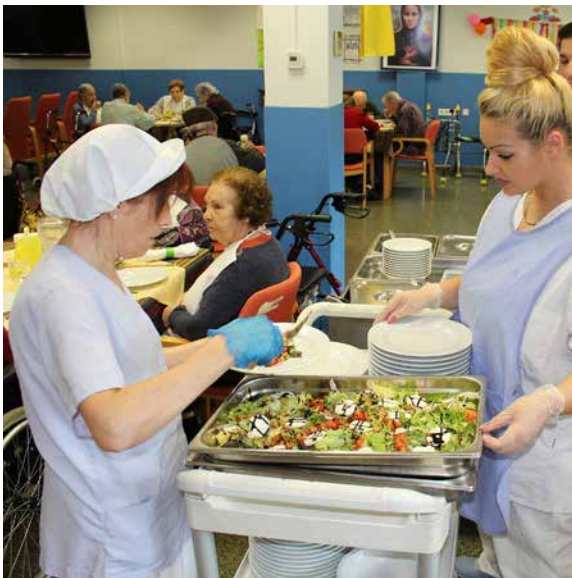
Equipo de cocina.