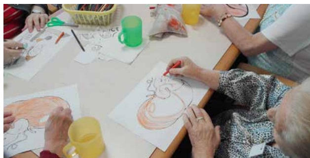
Taller de pintura en el Centro.