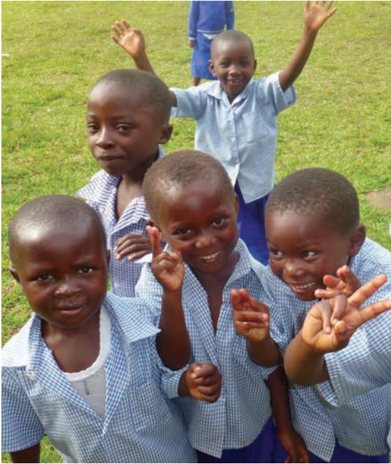
Alumnos del Centre d'Éducation Rubare (RD del Congo).