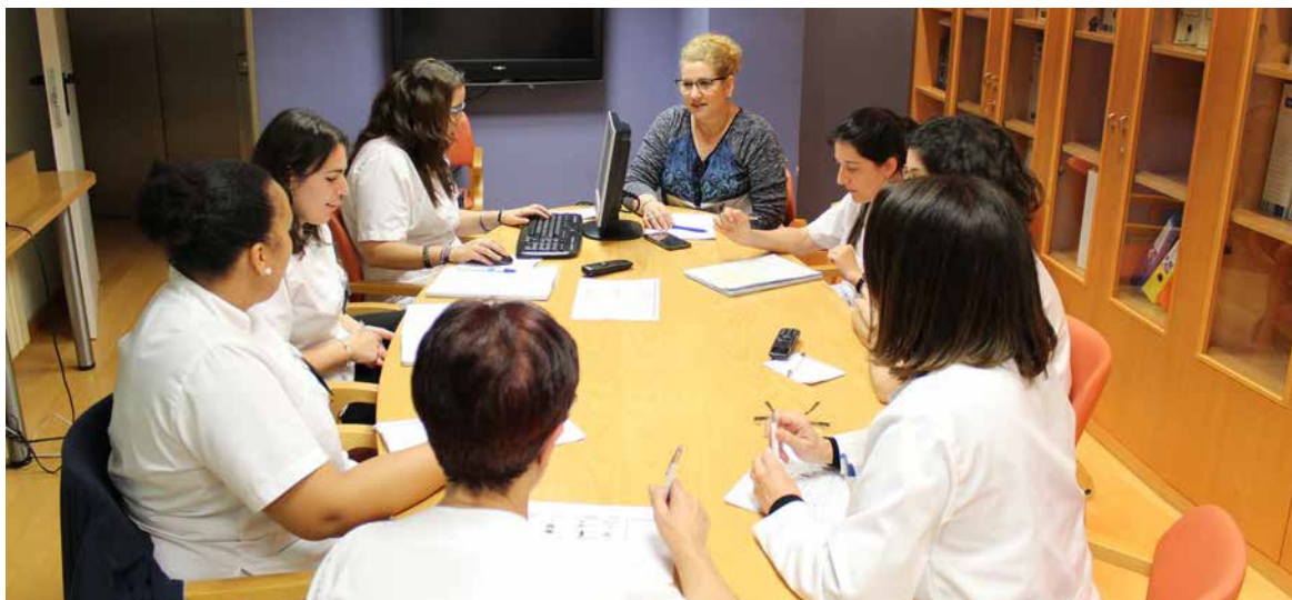
Reunión de equipo interdisciplinario.