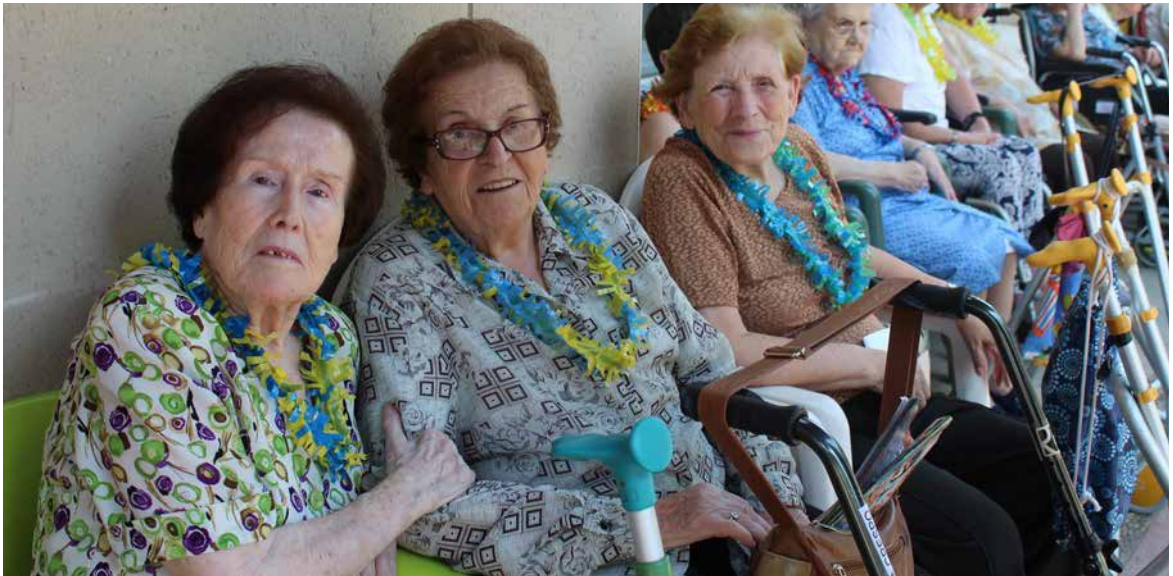
Fiesta de los cumpleaños.