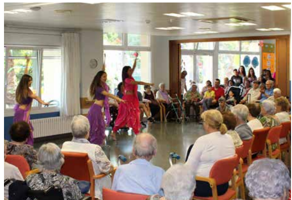
Actuación de una escuela de danza en el Centro.