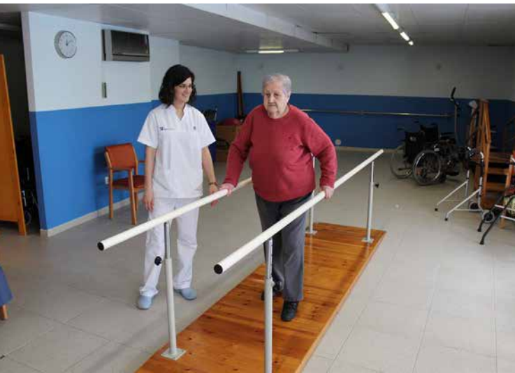
Sala de fisioterapia.