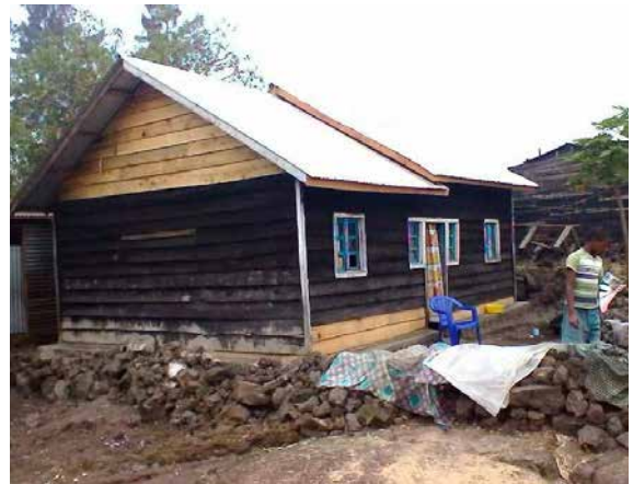
Casa construida para una familia en situación de vulnerabilidad.

A lo largo del año, el Equipo de Misiones ha participado en distintas actividades, en representación del Instituto y su Obra, con el objetivo de informar y sensibilizar sobre las problemáticas sociales, sanitarias y medioambientales que se viven en los países en los que tenemos presencia.