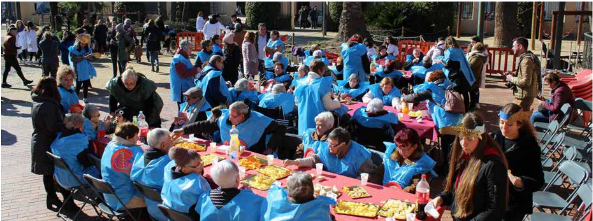
Actividades en la Residencia.