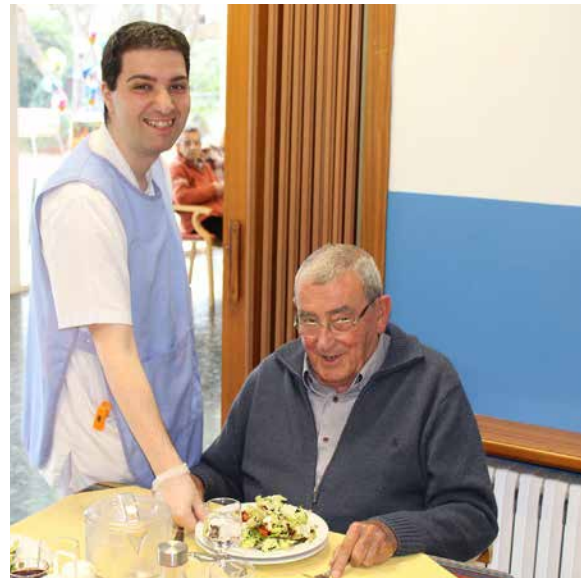
Gerocultor con un residente.