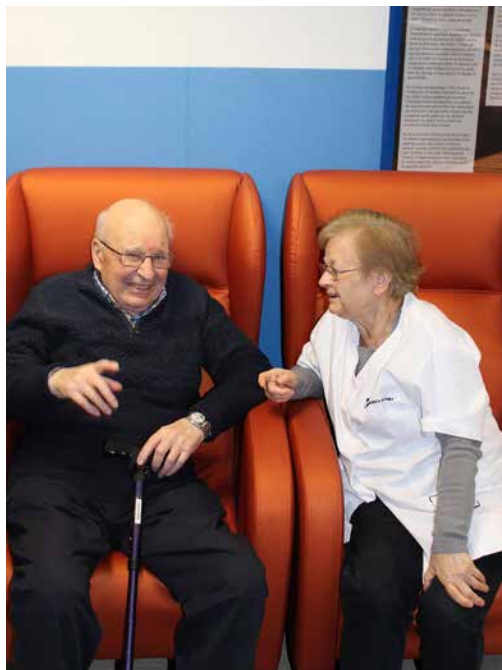
Actividad de Pastoral de la Salud.