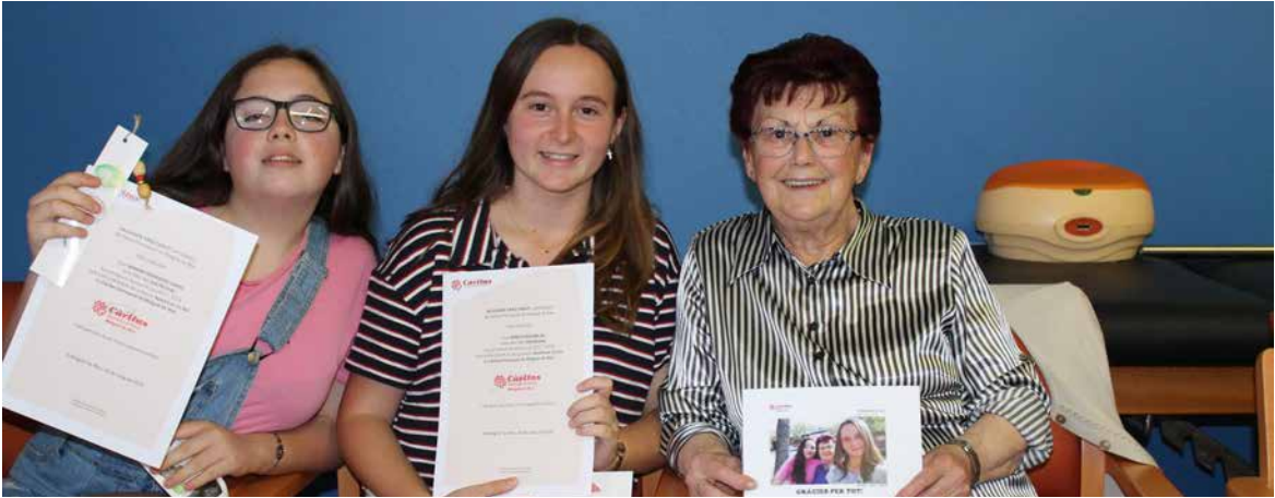
Proyecto "Apadrinar un abuelo".