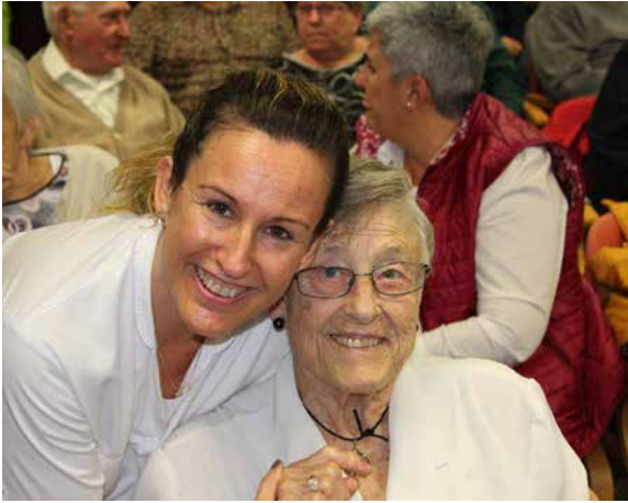
Animadora con una residente.