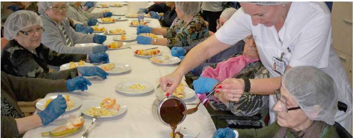
Taller de cocina en la sala de actividades del Centro.