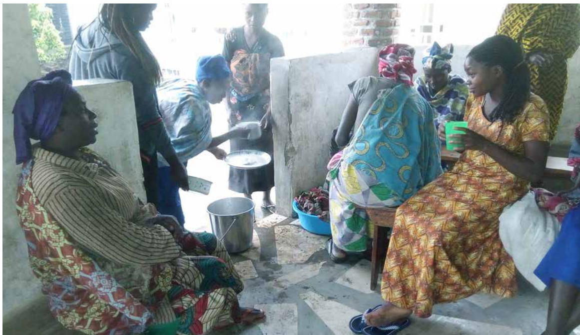
Desayuno para enfermos hospitalizados. Centro de Salud de Nyarusange (Ruanda).

Nuestra Obra está basada en los principios del humanismo cristiano y de la responsabilidad con la sostenibilidad y el medio ambiente. Sobre estos pilares hemos desarrollado diversas actividades como por ejemplo: