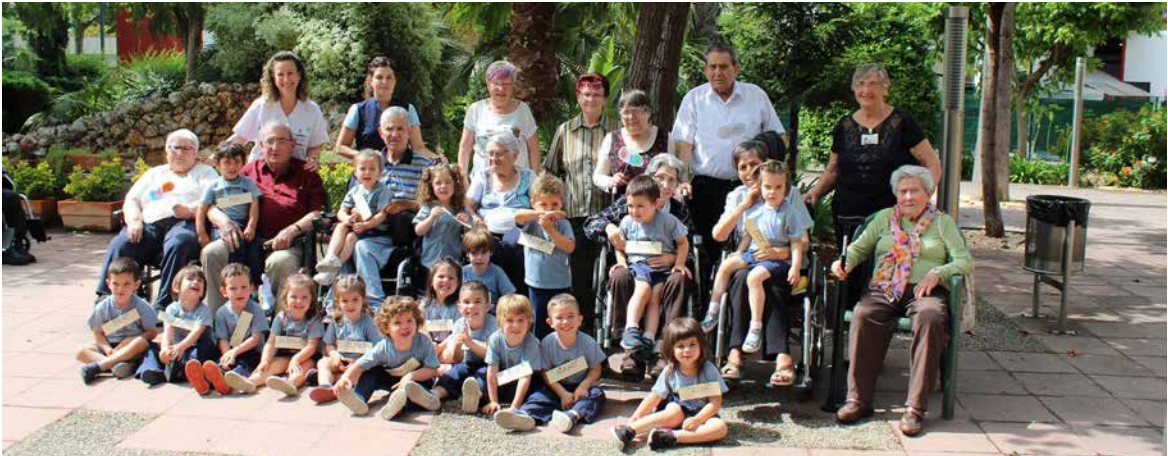
Proyecto "Pequeños Grandes Proyectos".