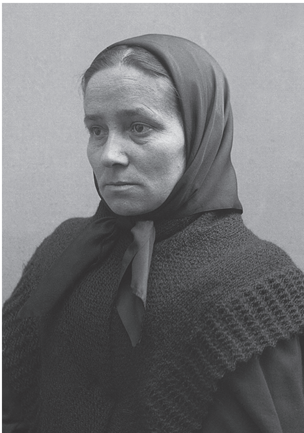
María Gay Tibau (Llagostera, 1813 – Girona, 1884)

Fundadora del Instituto de Religiosas de San José de Gerona